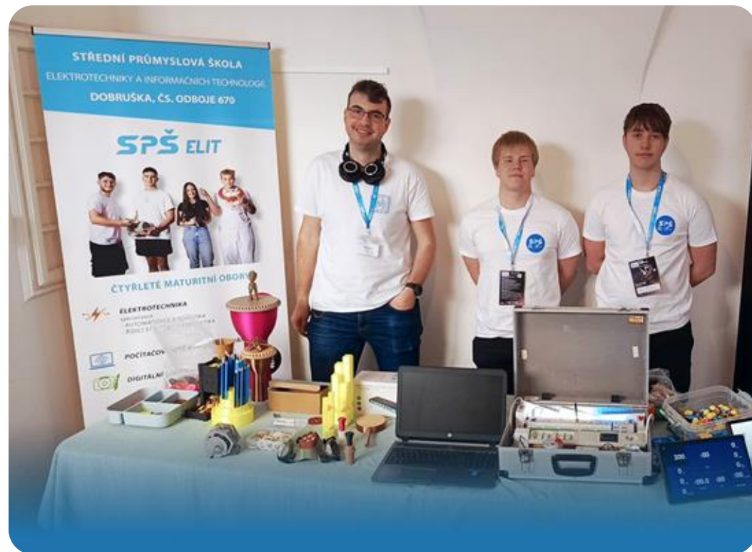
Účast na akci NOVO EXPO +inovace 2026 propojující technologie a pomoc druhým.