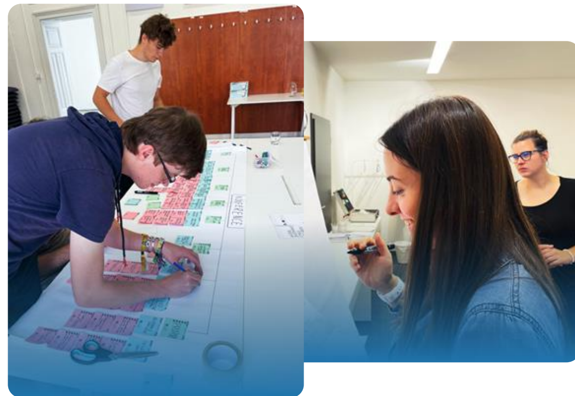
Workshop projektového řízení ve spolupráci s ACSA (naši projektoví manažeři jsou držitelé certifikace dle NSK )